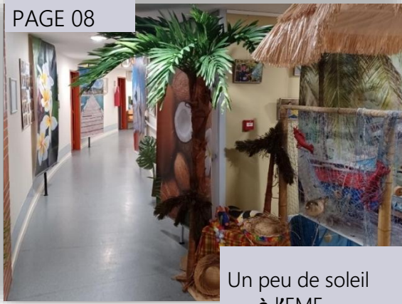
Un peu de soleil à l'EME...